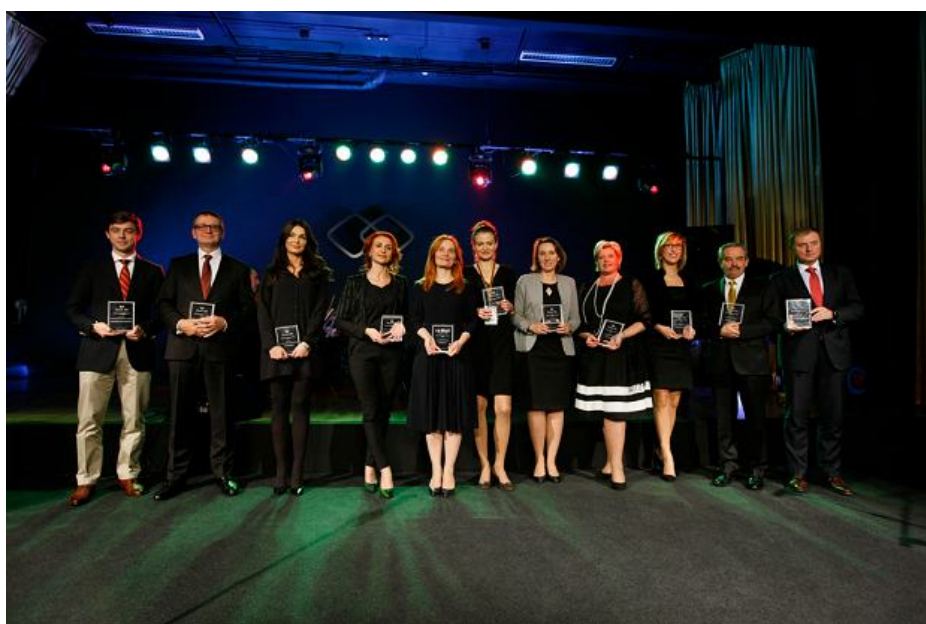
Laureaci konkursu Responsible Business Awards (Fundacja Fabryki Marzeń)